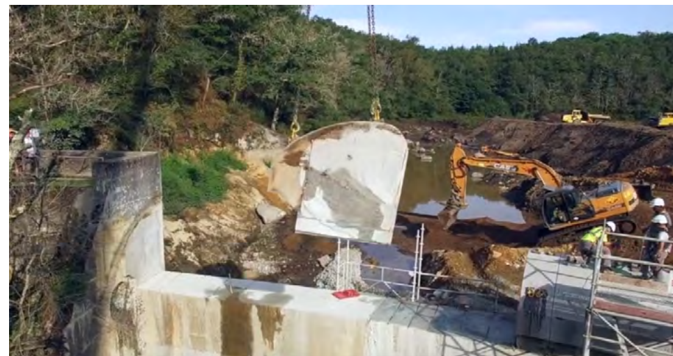
Images du démontage du Gué Giraut, tiré du reportage : http://www.aufildelaglance.fr/

Alors Oui les 2 moteurs de notre association que sont "l'intérêt général" et la "préservation des milieux" nous paraissent activés dans le double objectif de réduction des pressions anthropiques et de la renaturation. SRL continuera à accompagner ces initiatives, dans le cadre de la publication attendue en 2019 d'une nouvelle circulaire nationale relançant la lutte pour la restauration écologique des cours d'eau.