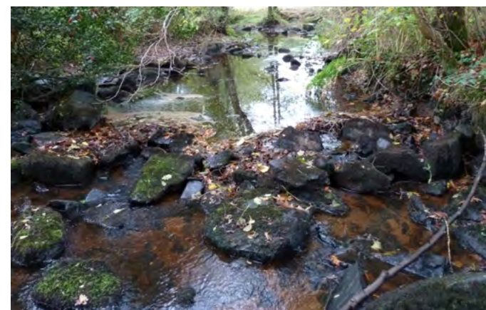
La Couze très basse le 31/10/2018 (P3)